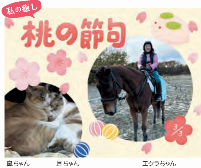
鼻ちゃん 耳ちゃん エクラちゃん

そんな時、候補者を選ぶ時に「一つのテーマ」を決めてみるのはどうでしょうか？「これは叶えてほしいな」「こういうふうになってほしいな」が見つかるを選びやすくなると思います。例えば私だったら現役を離れていても看護師魂は残存しています。だから、いつも現場目線、看護の未来を真剣に考え行動してくれる看護職の組織代表者を選択します。