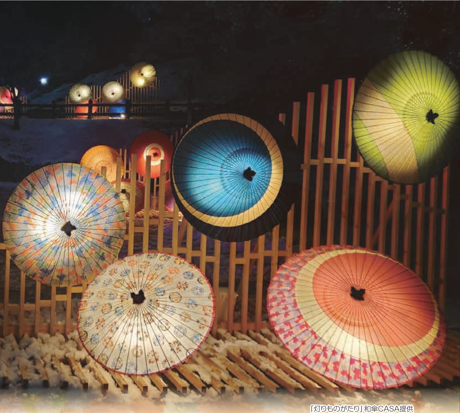
「灯りものがたり」